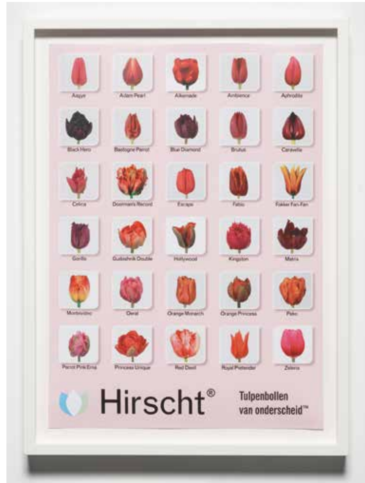
Damien Hirst Tulip Varieties